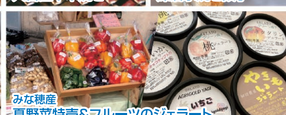
みな穂産 夏野菜特売&フルーツのジェラート