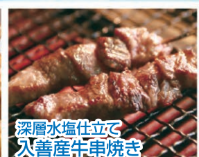
深層水塩仕立て 入善産牛串焼き