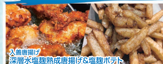
入善唐揚げ 深層水塩麹熟成唐揚げ&塩麹ポテト