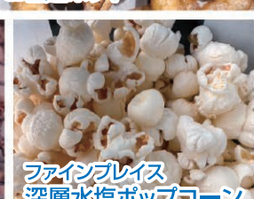
ファインブレイズ 深層水塩ポップコーン