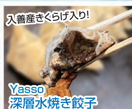
入善産きくらげ入り! Yasso 深層水焼き餃子