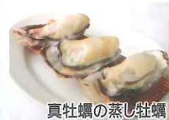
真牡蠣の蒸し牡蠣