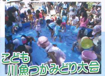
こども 川魚つかみどり大会