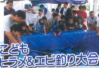
こども ヒラメ&エビ釣り大会