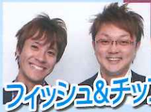
フィッシュ&チップス コント