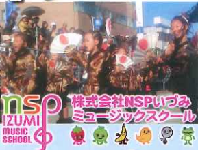
大道芸 ジャグリング