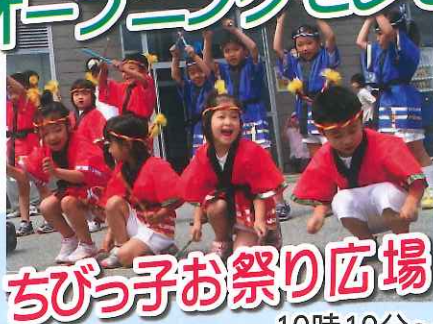
ちびっ子お祭り広場